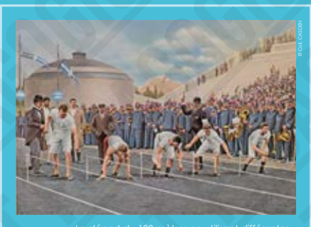
Le départ du 100 mètres en utilisant différentes méthodes, carte postale, 1896.

En 1896, le principe de « championnat du monde » est encore rare et les règles sportives varient d'un pays à l'autre. Ces premiers Jeux Olympiques sont organisés à la Pâque orthodoxe pour le 75 e anniversaire de l'État grec moderne né en 1830. Ces premiers Jeux Olympiques sont une réussite pour le roi grec Georges I er qui donne ainsi une image positive de son pays.