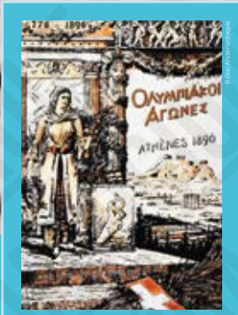
Jeux Olympiques. Athènes 1896, affiche non signée, 1896.

INTERDICTION D'IMPRIMER L'EXPOSITION par quelque procédé que ce soit sans l'accord express de la CASDEN.