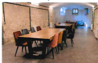
Salle de Co-Working