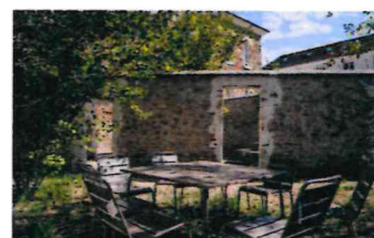
Jardin / Garden