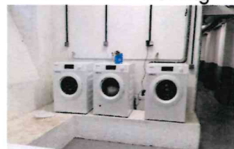
Laverie / Laundry

Service Gratuit sur place / Free access →