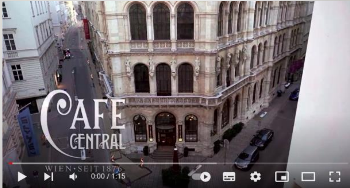
Café Central Wien - YouTube